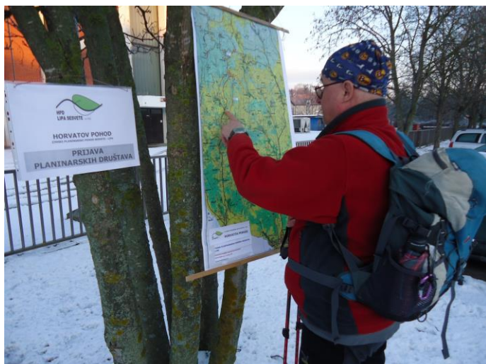
TRASA HORVATOVOG POHODA