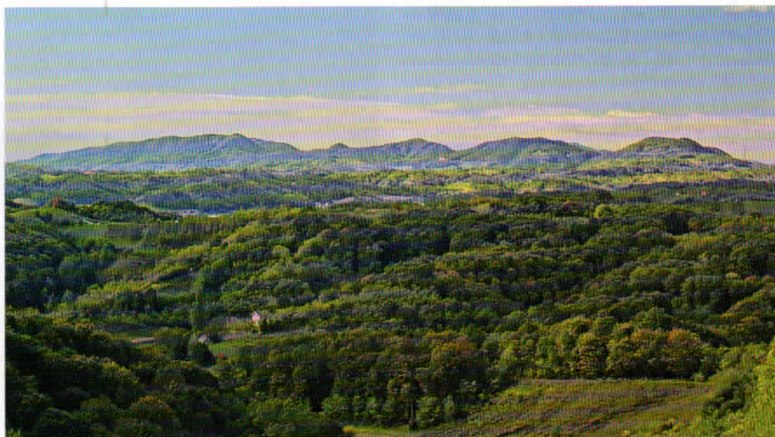
Zagorske gore i brežuljci